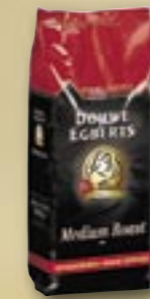
520030 Café Espresso Medium Roast Arabica **** 1 kg Par carton de 6 pièces