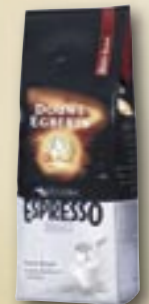
520031 Café Espresso décaféiné Dark Roast 500 g Par carton de 8 pièces