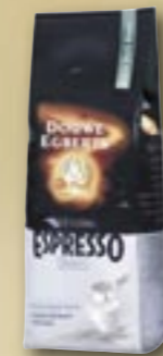
520029 Café Espresso Extra Dark Roast Arabica ***** 1 kg Par carton de 6 pièces

Avec l'espresso de Douwe Egberts, tout le monde peut savourer le café dans sa forme la plus pure. Une tasse d'espresso, c'est bien plus qu'un café avec beaucoup de caractère. C'est une méthode de préparation où l'on presse de l'eau presque bouillante sur le café finement moulu. La meilleure preuve qu'un café est préparé selon la méthode espresso, c'est une couche de crème égale, de couleur noisette. Ici également, nous vous offrons un assortiment de premier choix.