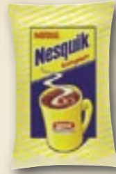
1520 Cacao Nesquik Komplett 1 kg Par carton de 10 pièces