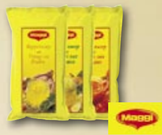
Potages Maggi 1 kg Par carton de 6 pièces