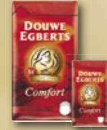
Café Comfort Arabica **** 520017 1 kg Par carton de 6 pièces