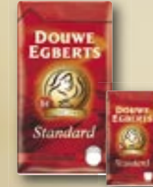
Café Standard Arabica *** 520019 1 kg Par carton de 6 pièces