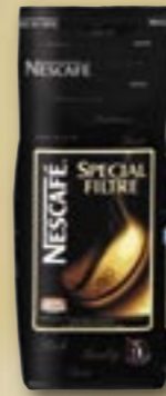
521144 Spécial Filtré 500 g Par carton de 12 pièces