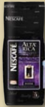
521140 Alta Rica 100% Arabica 500 g Par carton de 12 pièces

Nestlé, le plus grand torréfacteur du monde, est pour le consommateur la garantie de qualité, satisfaisant les goûts de chaque consommateur, à chaque moment de la journée.