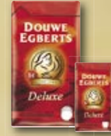
Café Deluxe Arabica ***** 520015 1 kg Par carton de 6 pièces