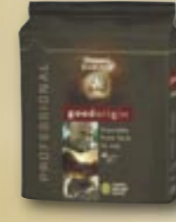
520027 Café Good origin Arabica **** 1,5 kg Par carton de 4 pièces