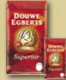
Café Supérieur Arabica ***** 520013 1 kg Par carton de 6 pièces

moindre concession à la qualité. Douwe Egberts a toujours une réponse exquise aux désirs les plus hétéroclites. C'est pour cela que chaque tasse est un véritable plaisir. Faites l'essai vous-même et choisissez dans l'assortiment que nous vous présentons aujourd'hui.