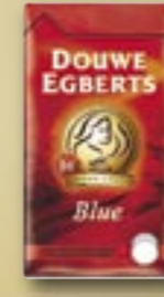
520022 Café décaféiné - Blue 500 g Par carton de 12 pièces