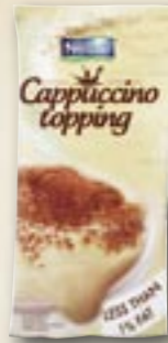
560040 Lait Cappuccino Topping 1 kg Par carton de 12 pièces