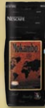
521142 Mokambo 500 g Par carton de 12 pièces